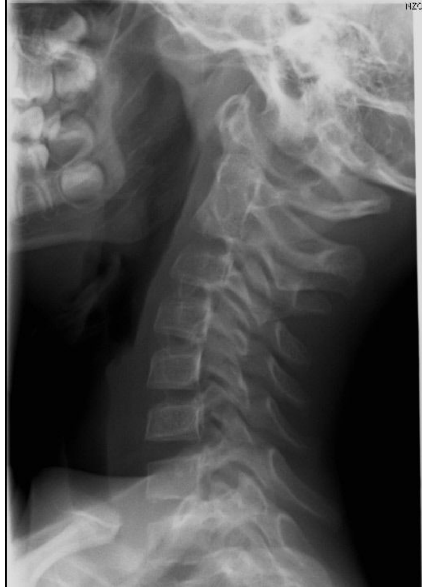
po 26 zab